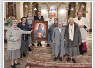
Las MSC en la Santa Misa en Sant'Angelo Lodigiano.