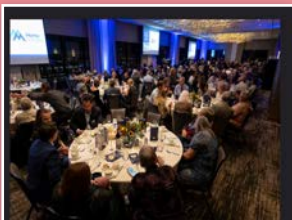
Una foto de la 23.ª Gala en Colorado.