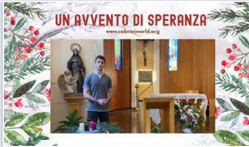
Vídeo de Adviento de la Provincia Mater Gratiae.

Como cada año en el mundo cabriniano, la Navidad ha llegado en medio de muchas festejos y celebraciones. Ya en Adviento, todas las comunidades se han preparado para vivir esta festividad bajo el signo de la esperanza. En particular, como oficina de comunicación de la Curia General hemos pedido a cada Provincia y Región que enviaran un breve vídeo con las Hermanas y laicos para que nos contaran cómo vivir el Adviento en el espíritu cabriniano.