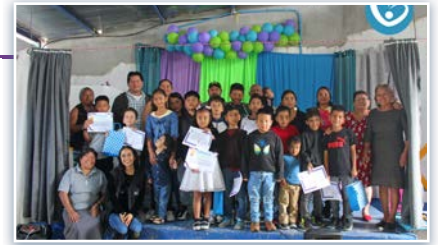
Clausura del año escolar del Dispensario San José.

* A principios de noviembre en el Dispensario San José zona 6 en Guatemala se llevó a cabo el cierre de las actividades del año escolar. Después de un 2024 lleno de aprendizaje, momentos alegres e inolvidables, los niños del programa Chispa Modificado festejaron la clausura del año con un hermoso espectáculo teatral en el que nos enseñaron la importancia de cuidar nuestra salud. Se agradece a todas las personas que de una forma u otra han hecho posible este momento.