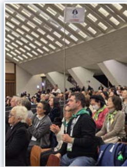
Algunos participantes esperan el paso del Santo Padre.