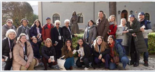
Foto de grupo frente a la estatua de la Madre Cabrini en la Basílica de San Pablo Extramuros.