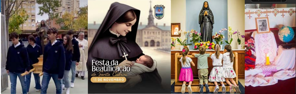
Fiesta del 14 de noviembre en el Colegio Cabrini de Madrid, tarjeta preparada por la Provincia Santa Francisca Cabrini para la fiesta de beatificación de la Madre Cabrini, foto del Santuario de la Madre Cabrini en Colorado e imagen del altar preparado para las celebraciones del 13 y 14 de noviembre en Etiopía.

Misioneras del Sagrado Corazón de Jesús | Noviembre - Diciembre 2024 | www.cabriniworld.org