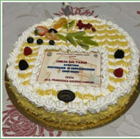
Pastel para la inauguración del centenario de la consagración de la iglesia del Tabor.