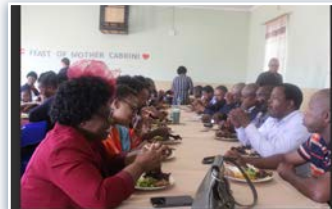
Fiesta de la Madre Cabrini en eSwatini.