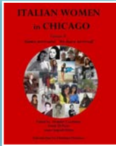
Portada del libro «Italian women in Chicago».