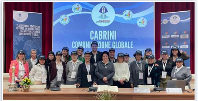
Foto de grupo al final de la jornada del 23 de enero.