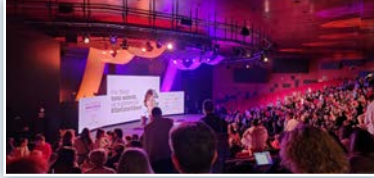
Congreso de escuelas católicas de España.

* A principios de noviembre en el Dispensario San José zona 6 en Guatemala se llevó a cabo el cierre de las actividades del año escolar. Después de un 2024 lleno de aprendizaje, momentos alegres e inolvidables, los niños del programa Chispa Modificado festejaron la clausura del año con un hermoso espectáculo teatral en el que nos enseñaron la importancia de cuidar nuestra salud. Se agradece a todas las personas que de una forma u otra han hecho posible este momento.