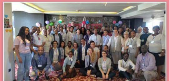
Foto de grupo en la Asamblea Regional.

Los representantes de las diferentes comunidades y ministerios de la Región Holy Spirit se reunieron en Addis Abeba para la Asamblea Regional. El encuentro comenzó el 3 de diciembre, fiesta de San Francisco Javier, santo que fue una gran inspiración para Madre Cabrini. La asamblea fue una ocasión para reflexionar sobre las raíces de nuestro ser misioneros y sobre cómo llevar adelante el legado de Madre Cabrini.