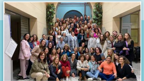
Visita al Colegio Cabrini de Madrid.