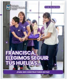
Colegio Cabrini Rosario celebra el 13 de noviembre.

catequistas, autoridades y donantes han bailado, cantado, tocado música y creado una hermosa fiesta para Madre Cabrini. Pasando luego a Italia, el 13 de noviembre se instaló e inauguró la estatua de la Madre Cabrini en la Basílica de San Pablo Extramuros de Roma. De esto hablamos en un número especial que salió hace un par de meses. Aquí puedes encontrar el video grabado por la emisora EWTN. El 16 de noviembre en Codogno se celebró el evento "Palabras y música para Madre Cabrini" en la Iglesia del Tabor para las celebraciones de las fiestas de Madre Cabrini y con motivo del Centenario de la Consagración de la Iglesia del Tabor. Este evento organizado en el Centro de Espiritualidad de Codogno por la Asociación "Una Santa per Amica" y las Misioneras del Sagrado Corazón de Jesús fue una iniciativa espiritual, artística y cultural para celebrar el Centenario y las fiestas del 13 y 14. También en la Provincia Santa Francisca Cabrini hubo muchos festejos por las celebraciones de Madre Cabrini en las escuelas de Brasil y Argentina. Como por ejemplo en el Colegio Cabrini de Rosario, donde organizaron una procesión, y el 11, 12 y 13 de noviembre se propuso un triduo de oración para preparar a estos importantes aniversarios para el Instituto.