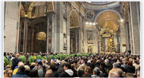
La entrada de los sacerdotes al comienzo de la Santa Misa en San Pedro.

El domingo 26 de enero por la mañana (Domingo de la Palabra) asistimos a Misa en la Basílica de San Pedro con el Santo Padre cuyo Evangelio fue sobre Jesús con el poder del Espíritu que recibe el rollo del profeta Isaías.