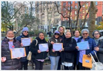
Los miembros de la JFI en el lanzamiento del Programa UBP

* El 20 de noviembre, Cabrini Immigrant Services de Nueva York y los miembros de Justice for Immigrants se unieron para lanzar un programa llamado Unemployment Bridge Program (UBP). De hecho, el sistema de empleo de Nueva York ha excluido a trabajadores independientes, autónomos e inmigrantes indocumentados. La UBP es una propuesta que garantizaría la estabilidad económica a más de 750.000 trabajadores que actualmente no tienen acceso al subsidio de desempleo.