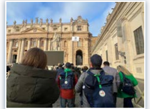
Fase finale del pellegrinaggio alla Porta Santa.

de Roma, y para la celebración eucarística, en la fiesta de San Francisco de Sales, patrón de los periodistas. El pasaje del Evangelio que nos acompañó fue el de la adúltera (Jn 8, 1-11) y quien presidió la celebración fue el Cardenal Baldo Reina, Vicario General del Papa para la diócesis de Roma.