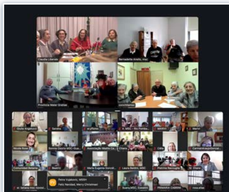
Llamada de Navidad de Zoom con MSC y laicos cabrinianos.