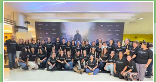
Avance de la película Cabrini en São Paulo, Brasil.

El 26 de noviembre, las Misioneras del Sagrado Corazón de Jesús, los laicos corresponsables, los colaboradores, los amigos de las hermanas cabrinianas, los influencers y los religiosos participaron en el estreno de la película CABRINI en São Paulo y en otras ciudades brasileñas. La espera era enorme y el deseo de ver a la Santa Fundadora en la pantalla grande aún más. Desde Brasil nos escribieron: "La película conmueve, inspira, hace sonreír, llorar y, sobre todo, reflexionar. Cabrini nos enseña que TODO es posible en Aquel que nos fortalece. Todos han dejado el cine entusiasmados, con el deseo de difundir la película tanto como sea posible, para que esta extraordinaria historia pueda ser conocida por muchas más personas".