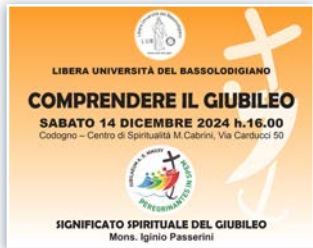
Cartel del evento «Comprendere il Giubileo»