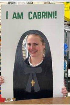
Escuela secundaria Cabrini de Nueva Orleans.

celebraciones de la Semana de Madre Cabrini! También en la Escuela Sagrada Familia nº 1 de Nicaragua celebraron el 144 aniversario de la fundación del Instituto de las Hermanas Misioneras del Sagrado Corazón de Jesús. Además se han rezado novenas en diferentes misiones de nuestro Instituto, como por ejemplo en el St. Frances Cabrini Shrine en Nueva York, Colorado y en la Región Holy Spirit. Particularmente en Uganda, la fiesta comenzó mucho antes con la preparación de los comités, los ensayos de danza, los coros, las presentaciones, la comida y la organización del entorno... todo ha sido pensado hasta el más mínimo detalle. El día fue precioso y las mujeres y todas las comunidades del campo de refugiados de Pagirinya llegaron al Centro Cabrini para la fiesta. La Misa estuvo presidida por el Obispo de la Diócesis, Rev. Sabino Ocan Odoki, quien en la homilía habló de la gran mujer que fue Madre Cabrini, mostrando su aprecio por ella y por las misioneras que están aquí y que hoy son Madre Cabrini. Fue una oportunidad para conocer las siete comunidades en las que trabajamos, con las especificidades de cada una. Una multitud de mujeres de los grupos y proyectos, niños,