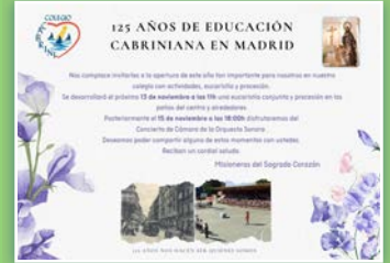
Cartel de evento en Madrid.

La comunidad MSC de Sadama celebra el primer aniversario de la misión. Sadama es la misión más reciente de la Región Holy Spirit y se inauguró el 18 de noviembre de 2023. En este año, la comunidad se ha asentado en la zona, colaborando con la parroquia vecina, conociendo a la población y evaluando las necesidades de las comunidades locales. La celebración se abrió con una misa en la parroquia de Santa Ana, oficiada por el obispo y en presencia de las hermanas MSC de Dubbo y Wallacha. Después de la misa, las hermanas compartieron con los niños y el personal de la escuela cercana la historia de Madre Cabrini.