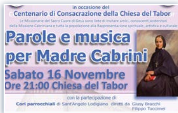
Iniciativa en la Iglesia del Tabor en Codogno.

catequistas, autoridades y donantes han bailado, cantado, tocado música y creado una hermosa fiesta para Madre Cabrini. Pasando luego a Italia, el 13 de noviembre se instaló e inauguró la estatua de la Madre Cabrini en la Basílica de San Pablo Extramuros de Roma. De esto hablamos en un número especial que salió hace un par de meses. Aquí puedes encontrar el video grabado por la emisora EWTN. El 16 de noviembre en Codogno se celebró el evento "Palabras y música para Madre Cabrini" en la Iglesia del Tabor para las celebraciones de las fiestas de Madre Cabrini y con motivo del Centenario de la Consagración de la Iglesia del Tabor. Este evento organizado en el Centro de Espiritualidad de Codogno por la Asociación "Una Santa per Amica" y las Misioneras del Sagrado Corazón de Jesús fue una iniciativa espiritual, artística y cultural para celebrar el Centenario y las fiestas del 13 y 14. También en la Provincia Santa Francisca Cabrini hubo muchos festejos por las celebraciones de Madre Cabrini en las escuelas de Brasil y Argentina. Como por ejemplo en el Colegio Cabrini de Rosario, donde organizaron una procesión, y el 11, 12 y 13 de noviembre se propuso un triduo de oración para preparar a estos importantes aniversarios para el Instituto.