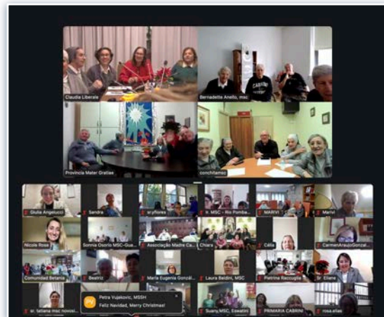
Chamada de Natal do Zoom com os leigos MSC e Cabrinianos.