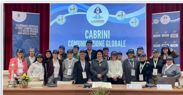
Foto de grupo no final do dia em 23 de janeiro.