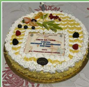
Bolo para a abertura da consagração do centenário da Igreja Tabor.