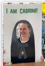
Escola de Ensino Médio Cabrini, Nova Orleans.