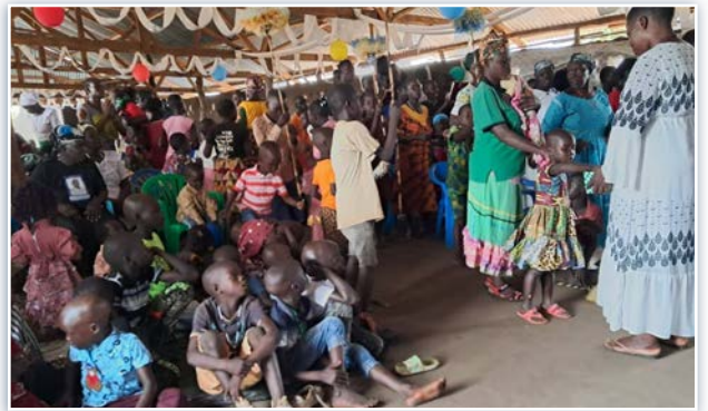
A comunidade Pagirinya durante as celebrações do Santo Natal.

foram realizadas nos santuários de Denver e Nova York em preparação para o Natal, que contou com a presença de muitos fiéis. Mesmo na escola Cabrini, em Madri, foi oferecido aos alunos um caminho de Advento, com orações, atividades, momentos de reflexão e partilha, diferentes de acordo com as faixas etárias. A representação viva agora usual da Natividade foi realizada em Londres em 21 de dezembro. O evento foi preparado pela comunidade cabriniana de Londres, realizado no Honor Oak Park e transmitido ao vivo no YouTube. Em Uganda, por outro lado, as freiras