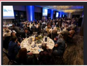
Uma foto da 23ª Gala no Colorado.