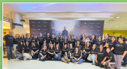
Estreia do filme Cabrini em São Paulo, Brasil.

A celebração abriu com uma missa na paróquia de Sant'Anna, oficiada pelo bispo e com a presença das irmãs MSC de Dubbo e Wallacha. Após a missa, as irmãs compartilharam a história de Madre Cabrini com as crianças e funcionários da escola próxima.