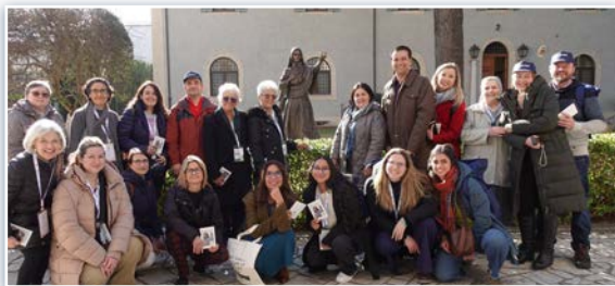
Foto de grupo em frente à estátua de Madre Cabrini na Basílica de São Paulo Fora dos Muros.