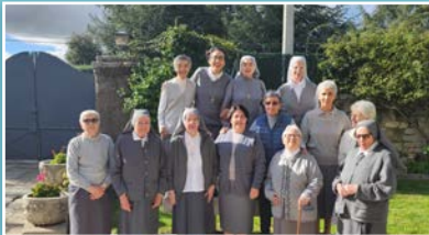
Visita à Comunidade de Los Molinos, na Espanha.