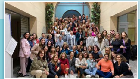
Visita ao Colégio Cabrini em Madri.