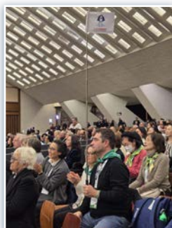
Alguns participantes aguardam a passagem do Santo Padre.

No sábado 25 , nos encontramos muito cedo pela manhã no início da Via della Conciliazione para podermos fazer a peregrinação à Porta Santa juntos. Juntamente com o grupo de língua inglesa, percorremos todo o caminho da Conciliação até chegarmos à Porta Santa da Basílica de São Pedro. Após atravessarmos a Porta, fomos até a Sala Paulo VI e participamos do encontro moderado pelo jornalista Mario Calabresi com os testemunhos dos jornalistas Maria Ressa e Colum McCann. Foi emocionante testemunhar a entrada do Papa, que fez questão de cumprimentar o maior número possível de pessoas. Boa parte de nosso grupo almoçou junto, e depois nos separamos para as diferentes iniciativas organizadas para o Jubileu na cidade de Roma, e que cada participante havia escolhido previamente de acordo com seu interesse.