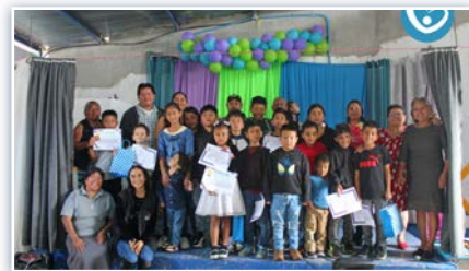
Encerramento do ano letivo Dispensário San José.

* No início de novembro, as atividades do ano letivo foram encerradas no Dispensário da zona 6 de San José, na Guatemala. Depois de um 2024 repleto de aprendizados, momentos alegres e inesquecíveis, as crianças do programa Chispa Modificado comemoraram o final do ano com um belo espetáculo teatral em que nos ensinaram a importância de cuidar de nossa saúde. Agradecemos a todas as pessoas que de uma forma ou de outra tornaram este momento possível.