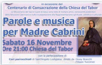
Iniciativa na Igreja Tabor em Codogno.

à Itália, em 13 de novembro, a estátua de Madre Cabrini foi instalada e inaugurada na Basílica de San Paolo Fuori le Mura, em Roma. Foi sobre isso que conversamos em uma reportagem que saiu há alguns meses. Aquí você pode encontrar o vídeo realizado pela emissora EWTN.