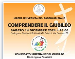
Pôster do evento “Compreendendo o Jubileu”