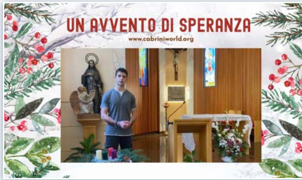
Vídeo do Advento da Província Mater Gratiae.

No Advento, todas as comunidades se prepararam para viver esse feriado em sinal de esperança. Em particular, como departamento de comunicação da Cúria Geral, pedimos a cada Província e Região que enviassem um pequeno vídeo com Irmãs e leigos contando como viver o Advento no espírito cabriniano.