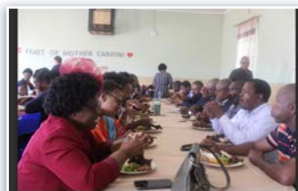
Festa de Madre Cabrini em eSwatini.