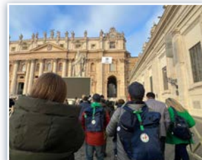
Etapa final da peregrinação até a Porta Santa.