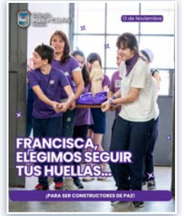
O Colégio Cabrini Rosario é celebrado em 13 de novembro.

de Espiritualidade de Codogno, foi uma iniciativa espiritual, artística e cultural para celebrar o Centenário e as festas dos dias 13 e 14. Também na Província de Santa Francisca Cabrini houve muitas festas para as celebrações de Madre Cabrini nas escolas do Brasil e da Argentina. Como por exemplo, no Colégio Cabrini em Rosário, onde organizaram uma procissão, e nos dias 11, 12 e 13 de novembro foi proposto um tríduo de oração tendo em vista esses importantes aniversários para o Instituto.