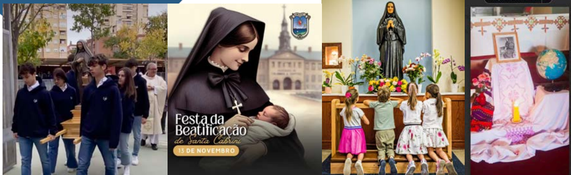
Celebração de 14 de novembro no Cabrini College em Madri, cartão preparado pela Província Santa Francisca Cabrini para a festa de beatificação de Madre Cabrini, foto do Santuário Madre Cabrini no Colorado e foto do altar preparado para as celebrações de 13 e 14 de novembro na Etiópia.