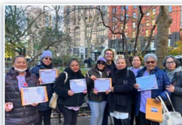
Membros da JFI no lançamento do Programa UBP

* Em 20 de novembro, o Cabrini Immigrant Services de Nova York e membros da Justice for Immigrants se uniram para lançar um programa chamado Unemployment Bridge Program (UBP) . O sistema de emprego de Nova York, de fato, excluiu trabalhadores como freelancers, autônomos e imigrantes sem documentos. A UBP é uma proposta que visa garantir estabilidade econômica a mais de 750 mil trabalhadores que atualmente não têm acesso ao seguro-desemprego.