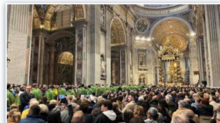
A entrada dos padres no início da Santa Missa em São Pedro.

Domingo de manhã, 26 de janeiro (Domingo da Palavra), assistimos à missa na Basílica de São Pedro com o Santo Padre.