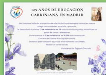
Pôster do evento em Madrid.