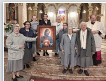
As MSCs na Santa Missa em Sant’Angelo Lodigiano.