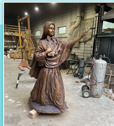
La estatua en la fundición de Chicago antes de partir hacia Roma.

El 26 de septiembre, la estatua salió de la fundición y pronto llegó a manos de la compañía naviera. La instalación tuvo lugar el 8 de noviembre y duró entre dos y cuatro horas.