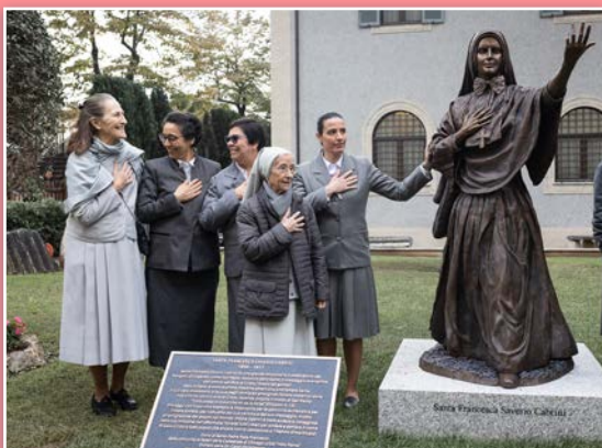
Algunas hermanas MSC durante la inauguración.