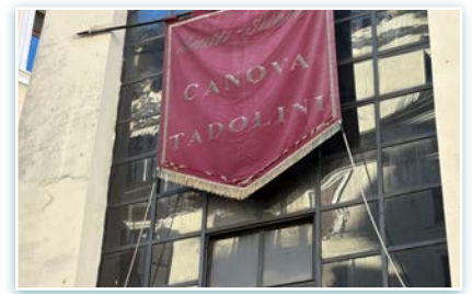
Foto: Edificio del museo.

Museo Canova - Tadolini, Via del Babuino, Roma