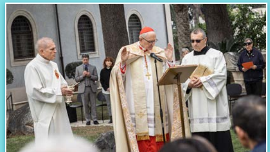
Momento de la bendición de la estatua.

La compasión y la dedicación de la Madre Cabrini siguen siendo visibles en los diversos apostolados de las Hermanas Misioneras del Sagrado Corazón, así como en los miles de seguidores suyos, aún no canonizados, que cuidan de los enfermos en hospitales, residencias de ancianos y similares, y difunden el mensaje del Evangelio en las aulas y en diversos entornos educativos de muchos países del mundo. Su carisma y su mensaje para la Iglesia y el mundo