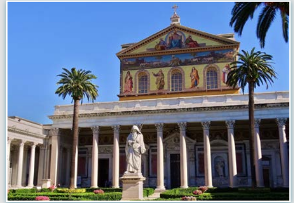
Exterior de la Basílica de San Pablo.

La Basílica de San Pablo Extramuros es una de las siete basílicas de Roma. Es una de las cuatro basílicas papales de Roma, una de las cuatro basílicas papales y la segunda más grande después de la de San Pedro. Se encuentra, según la tradición, en el lugar en el que fue enterrado el Apóstol Pablo. Tras el Edicto de Milán del año 313, gracias al cual se concedió libertad de culto a los cristianos, el emperador Constantino decidió donar dos basílicas a la recién fundada Iglesia, erigidas sobre las tumbas de Pedro y Pablo. Sin embargo, más tarde, en el siglo V, dada la continua afluencia de peregrinos a la tumba y el limitado tamaño del edificio original de la basílica de San Pablo, los tres emperadores entonces reinantes, Teodosio, Valentiniano II y Arcadio, se vieron obligados a construir un edificio más grande, invirtiendo su orientación hacia el oeste. Hubo que esperar hasta 1854 para que el Papa Pío IX inaugurara por fin la actual basílica monumental, que aún conserva en su interior lo que, según la tradición, fue la cadena que ató al apóstol Pablo al soldado romano mientras estaba de guardia en espera de juicio.