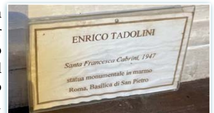
Foto: Placa modelo de escayola.