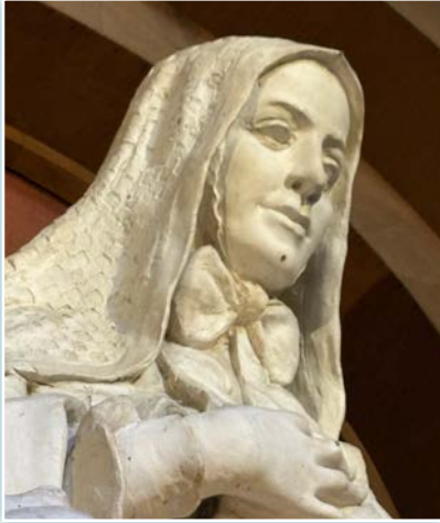
Foto: modelo de escayola, detalle de la cara.