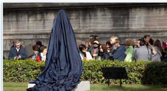
La estatua antes de ser inaugurada.

Participó también un grupo procedente de Chicago, que ya se encontraba en Italia y que en los días previos, había visitado lugares emblemáticos Cabrinianos, como