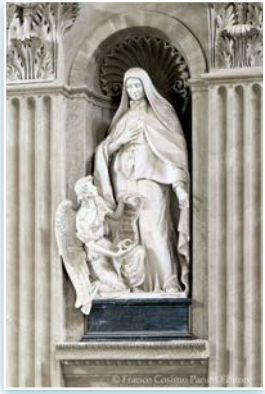
Estatua de Santa Francisca Javier Cabrini en la Basílica de San Pedro.