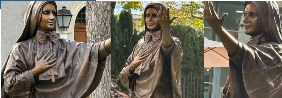
Estatua de Santa Francisca Javier Cabrini en la Basílica de San Pablo Extramuros de Roma.

Misioneras del Sagrado Corazón de Jesús | Noviembre 2024 | www.cabriniworld.org