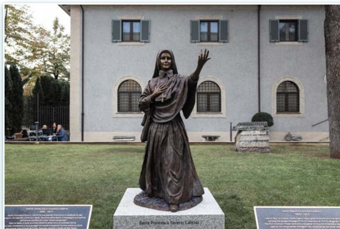
La estatua de Santa Francisca Javier Cabrini.

La estatua fue esculpida por Jessica LoPresti y Lou Cella en el estudio Rotblatt Amrany, cerca de Chicago. En St. Pauls se vertió una base de hormigón. Sobre el hormigón se colocó un pedestal de granito. La figura de bronce, de unos dos metros y medio de altura, se fijará al granito. La figura pesa 326 kg. El granito mide 111 cm de ancho, 127 cm de largo y 46 cm de alto. El peso aproximado es de poco más de 1.700 kg.