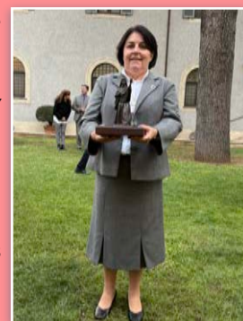
Hna. Eliane sostiene la estatua en miniatura, regalo de los artistas Cella y Lo Presti.

trabajar en este tiempo jubilar para la Mayor Gloria del Sagrado Corazón de Jesús, para que verdaderamente podamos caminar y crecer en sinodalidad hacia una civilización de Amor. Pocos días antes del comienzo del Año Jubilar, la Madre Cabrini ha vuelto a cruzar el océano, de América a Roma, convirtiéndose también en peregrina de la esperanza entre todos nosotros. Gracias a todos. Gracias de todo corazón".