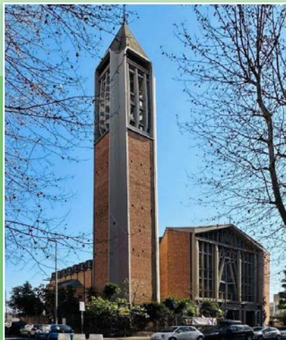
Exterior de la Parroquia de Santa Francisca Cabrini en Roma.